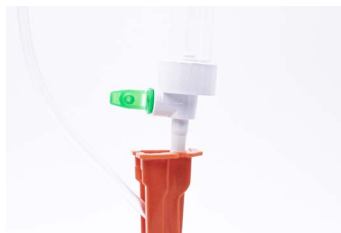
Aufnahme für Einstechdorn